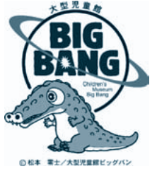
◀大型遊具 「マチカネワニの生体」

開館時間 ● 10時～17時（入館は16時30分まで） 休 館 日 ● 月曜日（月曜祝日の場合は、翌火曜日） 年末年始（12月29日～1月1日） 1月下旬～2月上旬と9月上旬に約2週間のメンテナンス休館 入 館 料 ● 幼児（3才以上）400円、小学生600円、中学生800円、大人1000円（20名様以上 団体割引あり） 〒590-0115 大阪府堺市茶山台1-9-1 （南海・泉北高速鉄道「泉ヶ丘」駅より200m） TEL 072-294-0999 ホームページ http://www.bigbang-osaka.or.jp