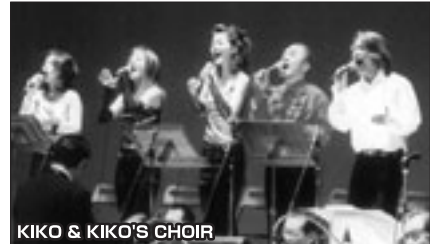
KIKO & KIKO'S CHOIR