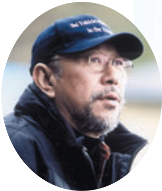
崔 洋一 監督