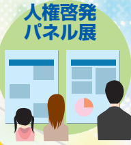
人権啓発 パネル展