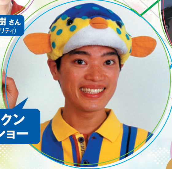
さかなケン トークショー