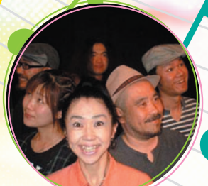
美穂蘭一座 (パフォーマンスグループ) のミュージカル