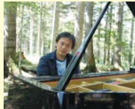
村松 健(ピアニスト)