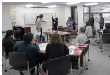
ファシリテーター養成講座

これらの取り組みと協力しながら、被差別・社会的マイノリティの人権問題を中心に、人権に関する相談や支援から課題を発見し、人権啓発によって社会に人権意識を広げるとともに、これらに取り組む人材養成を進め、そして、これらのネットワークづくりに取り組むことを4つの柱として、多様性が尊重され、差別のないコミュニティづくりを通じて、すべてのひとの人権が尊重される豊かな社会を実現しようと、一般財団法人大阪府人権協会は取り組んでいます。