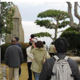
フィールドワーク