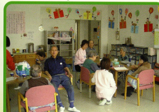
まちかどデイハウスひまわり ☎25-0294