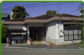
まちづくり協議会(作業所)