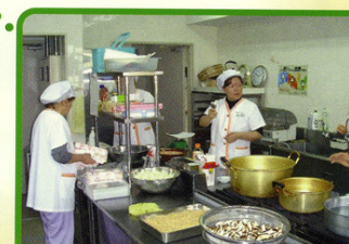
給食サービスたんぽぽ ☎23-4194