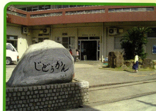
富田林市立児童館 ☎25-0666

富田林市立人権文化センター ☎25-0583 富田林市人権協議会 ☎24-3700 部落解放同盟富田林支部 ☎26-1697 移送サービス おーらい ☎26-1726