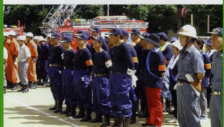
自主防災会事務局