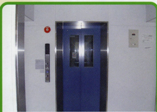
高齢者対応住宅(エレベータ設置)