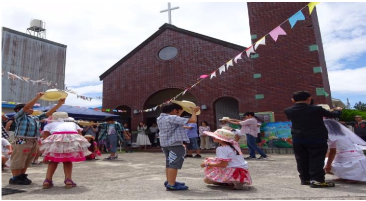
ブラジルにルーツをもつ子どもの居場所づくり事業 団体 プロジェクト・コンストルイル