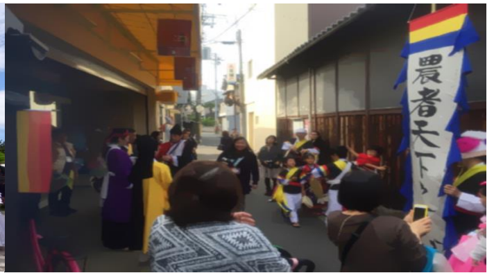
マイノリティアートフェスティバル〜マイノリティがアートと出会うとき 富田林編〜 団体 マイノリティアートプロジェクト