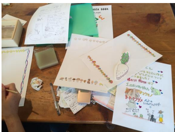
フリーペーパー製作中