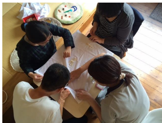
ワークショップ風景